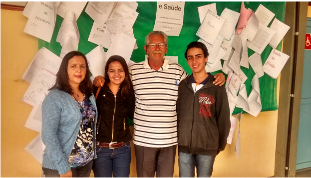
Exposição de trabalhos sobre S.U.S – E.E.Paula Frassinetti