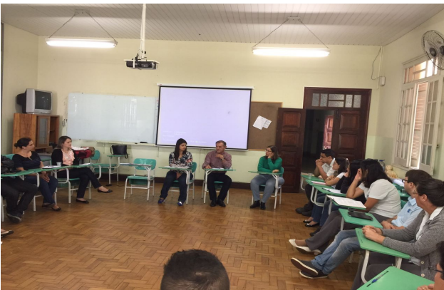
Capacitação das Vigilâncias Sanitárias da Micro Região de S.S.Paraiso juntamente com SRS/Passos