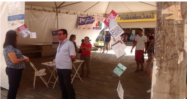
Exposição Semana do Consumidor – Praça da Matriz