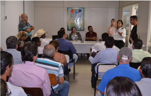
Reunião com feirantes - SEDEAGRO