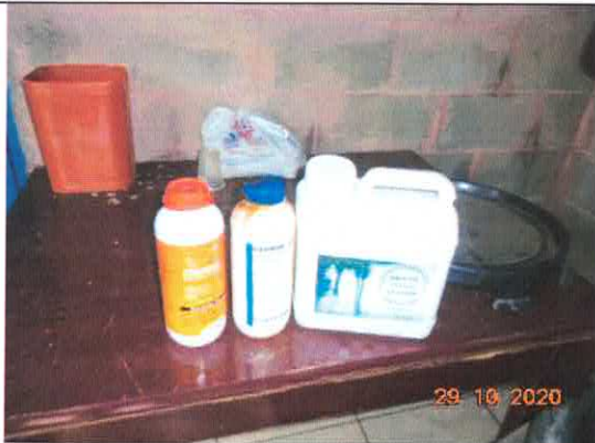
Figura 3: Embalagens dos produtos utilizados.