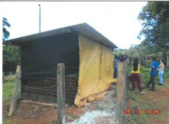
Figura 2: Sistema de tratamento das carcaças e cama de frango.