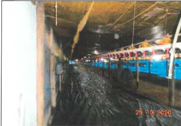
Figura 1: Área interna do galpão.