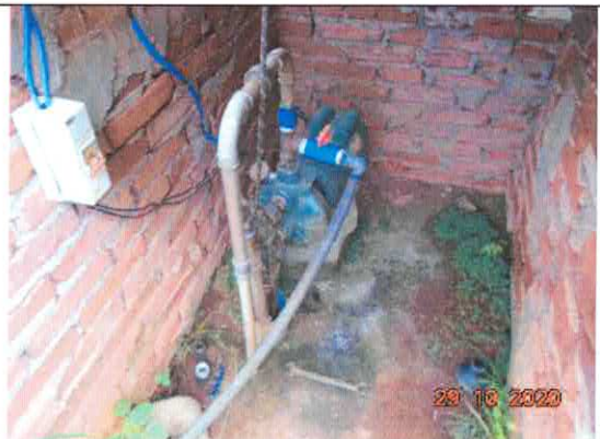
Figura 4: Poço artesiano.