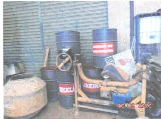
Figura 6: Acondicionamento de resíduos.