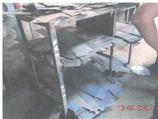
Figura 2: Resíduos do corte das chapas.