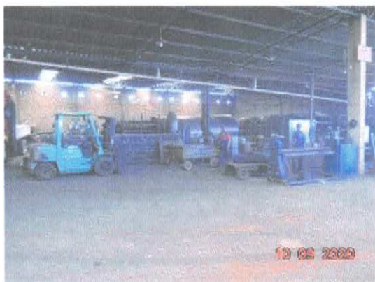
Figura 1: Área de produção.