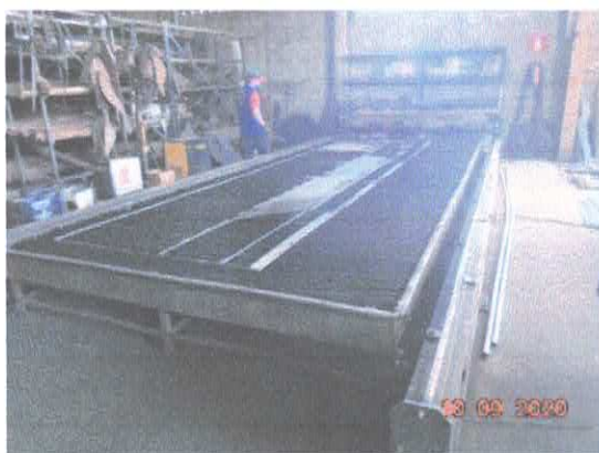
Figura 3: Máquina de corte a plasma.