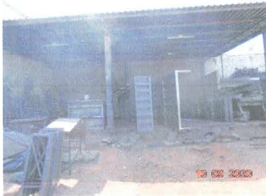
Figura 5: Serralheria