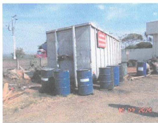
Figura 4: Disposição resíduos da máquina de corte a plasma