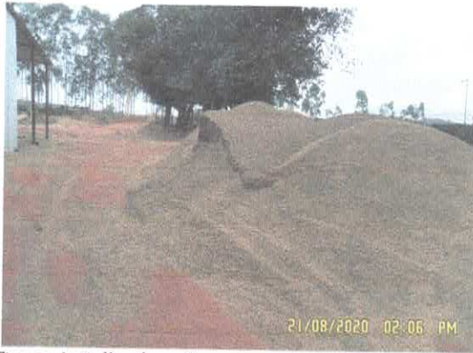
Figura 1: Palha de café usada no forno