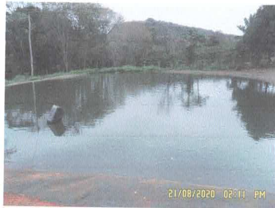
Figura 4: Acumulo d'água para bombeamento