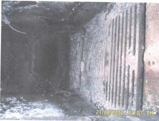
Figura 3: interior do forno