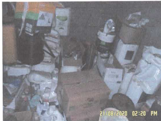
Figura 8: Acondicionamento dos agrotóxicos/fertilizantes.