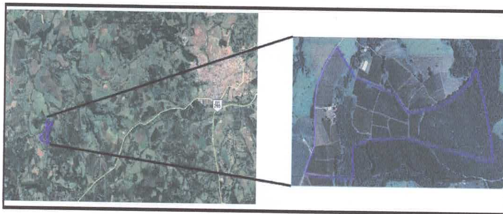
Figura 1: Localização do empreendimento

Localizado em área rural do município de São Sebastião do Paraíso/MG as margens da Rodovia BR 265, o empreendimento encontra-se instalado em propriedade denominada Morro Alto, com área total de 59 ha conforme a Certidão de Registro de Imóveis, Matrícula nº 3134. A figura 1 demonstra a localização do empreendimento.