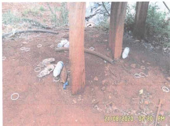
Figura 7: Embalagens fora do local de acondicionamento.