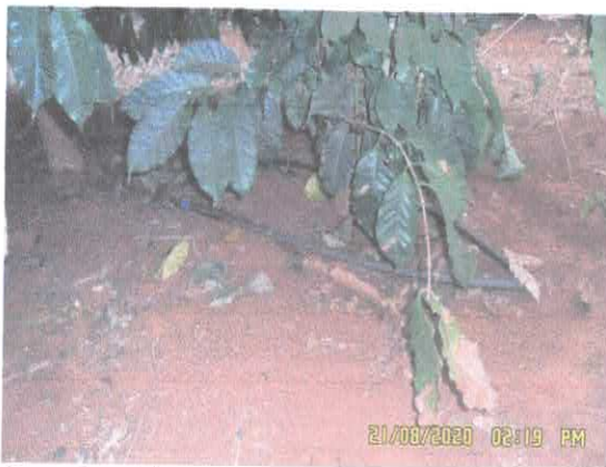
Figura 5: gotejamento