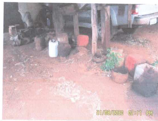
Figura 6: Tambores de óleo em local com piso permeável