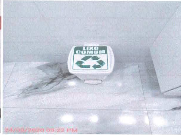
Figura 2: Acondicionamento dos resíduos