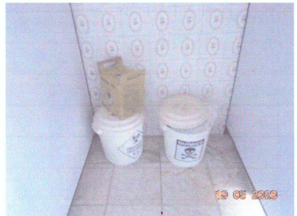
Figura 2: Armazenamento dos resíduos