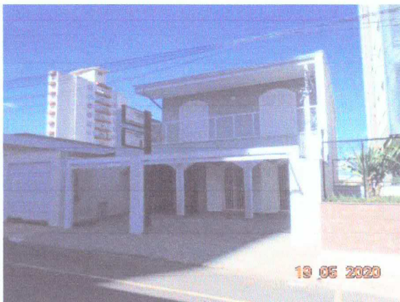
Figura 1: Fachada do empreendimento