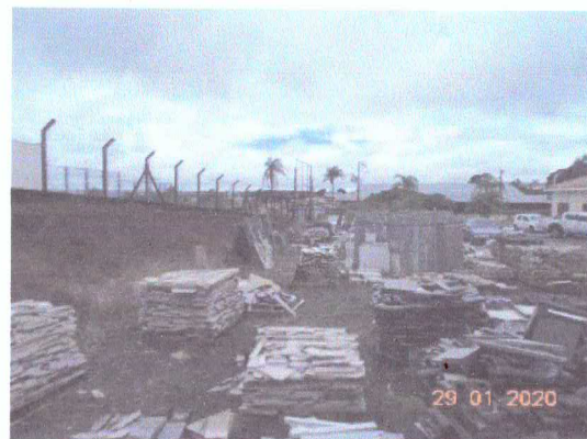
Figura 10: Estocagem de material para uso.