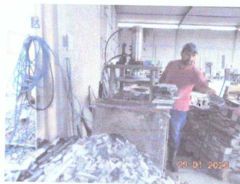
Figura 4: Reúso de pequenas placas.