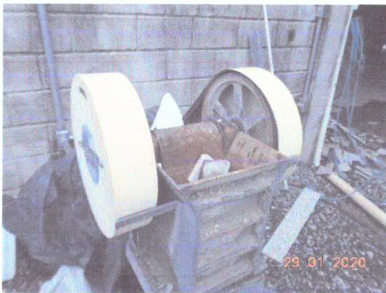
Figura 7: Britador para transformar resíduo em britas