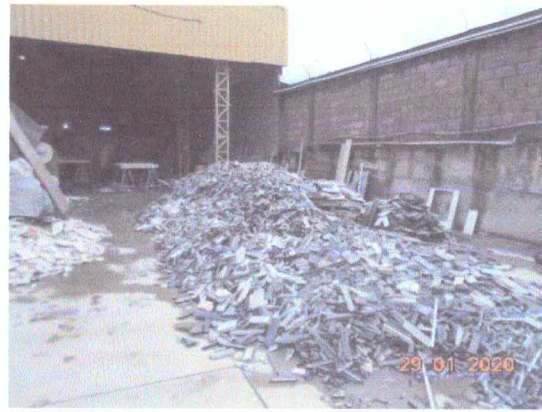
Figura 6: Estocagem de resíduos de corte.