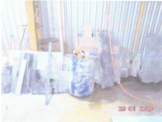
Figura 5: Acondicionamento de resíduos.