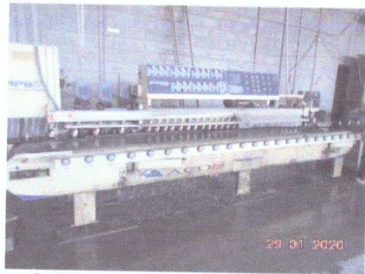
Figura 2: Máquina de corte com uso de água.