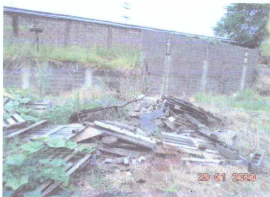
Figura 9: Resíduos de paletes.