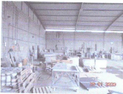
Figura 1: Máquinas e bancadas onde realiza o processo.