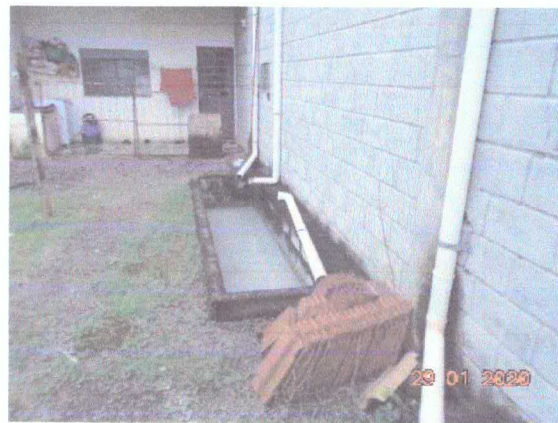
Figura 8: Reúso da água no processo.