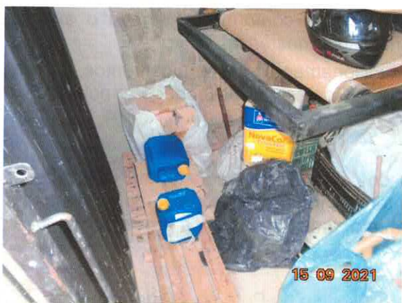
Figura 5: Área onde são acondicionados os resíduos.