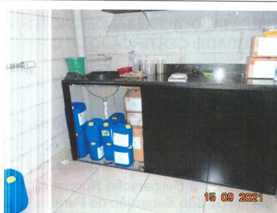
Figura 2: Sala de preparo da cor.