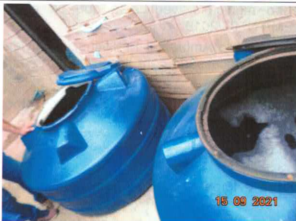
Figura 3: Reservatórios para resfriamento do efluente.