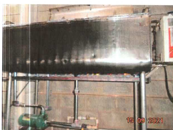
Figura 6: Equipamento para aquecimento da água.