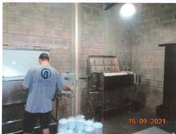
Figura 1: Equipamentos utilizados no processo.